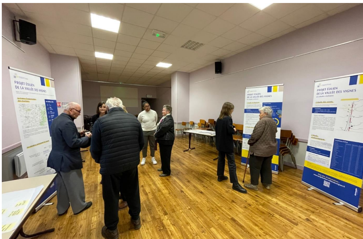
Forum d'information du 23 novembre 2022