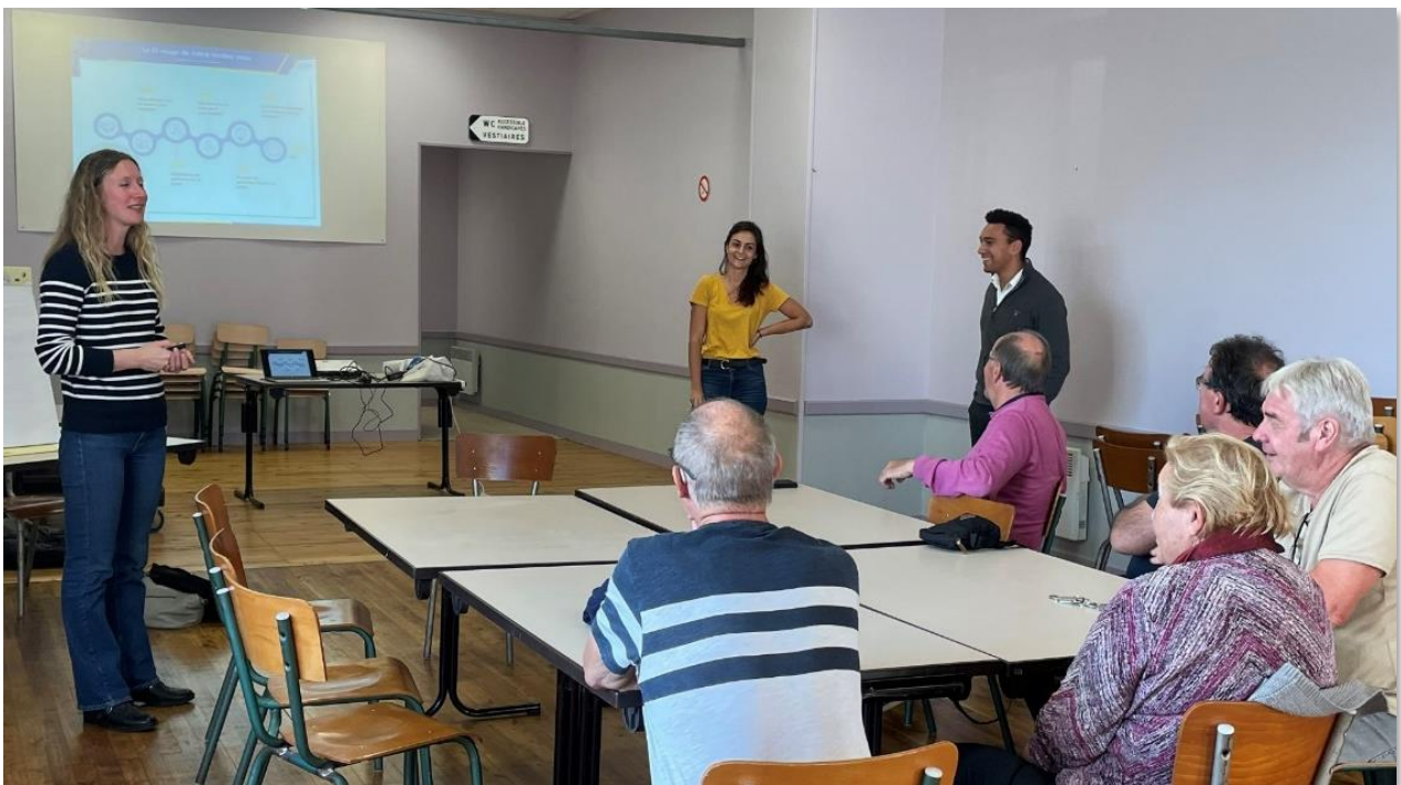
Comité de Pilotage du 6 octobre 2022