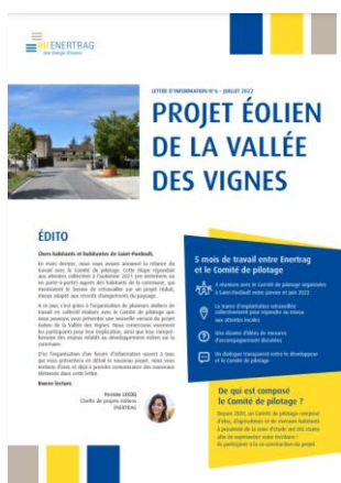
Exemple de première page de lettre d'information

Toutes les lettres d'information sont disponibles en Annexes de ce document.