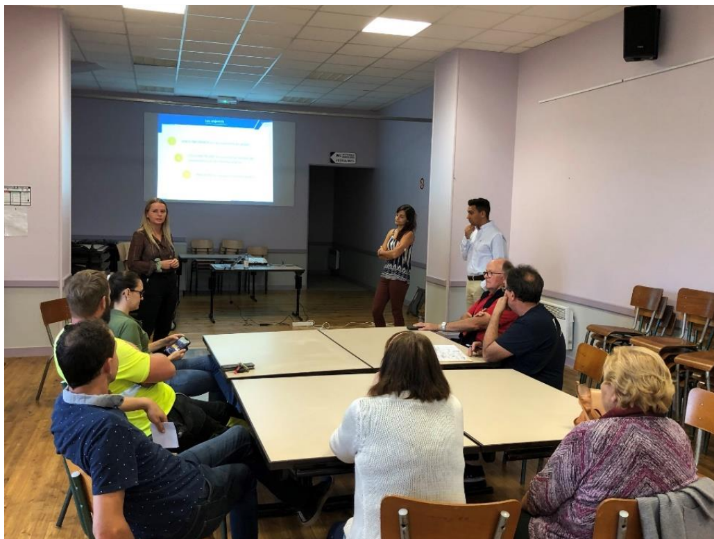
Comité des élus du 19 octobre 2022