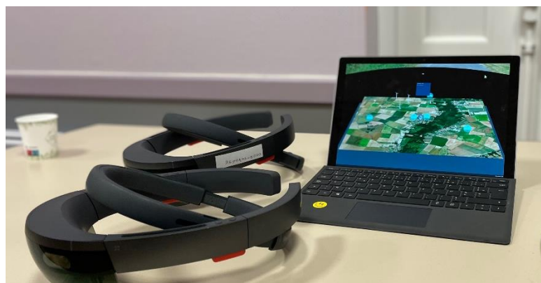
Holopolis utilisé le 23 novembre 2022

Finalement, un atelier de réalité mixte était mis à disposition des participants avec l'outil HOLOPOLIS (développé par Demopolis Concertation) afin de visualiser, en réalité mixte, la trame d'implantation ainsi que les photomontages.