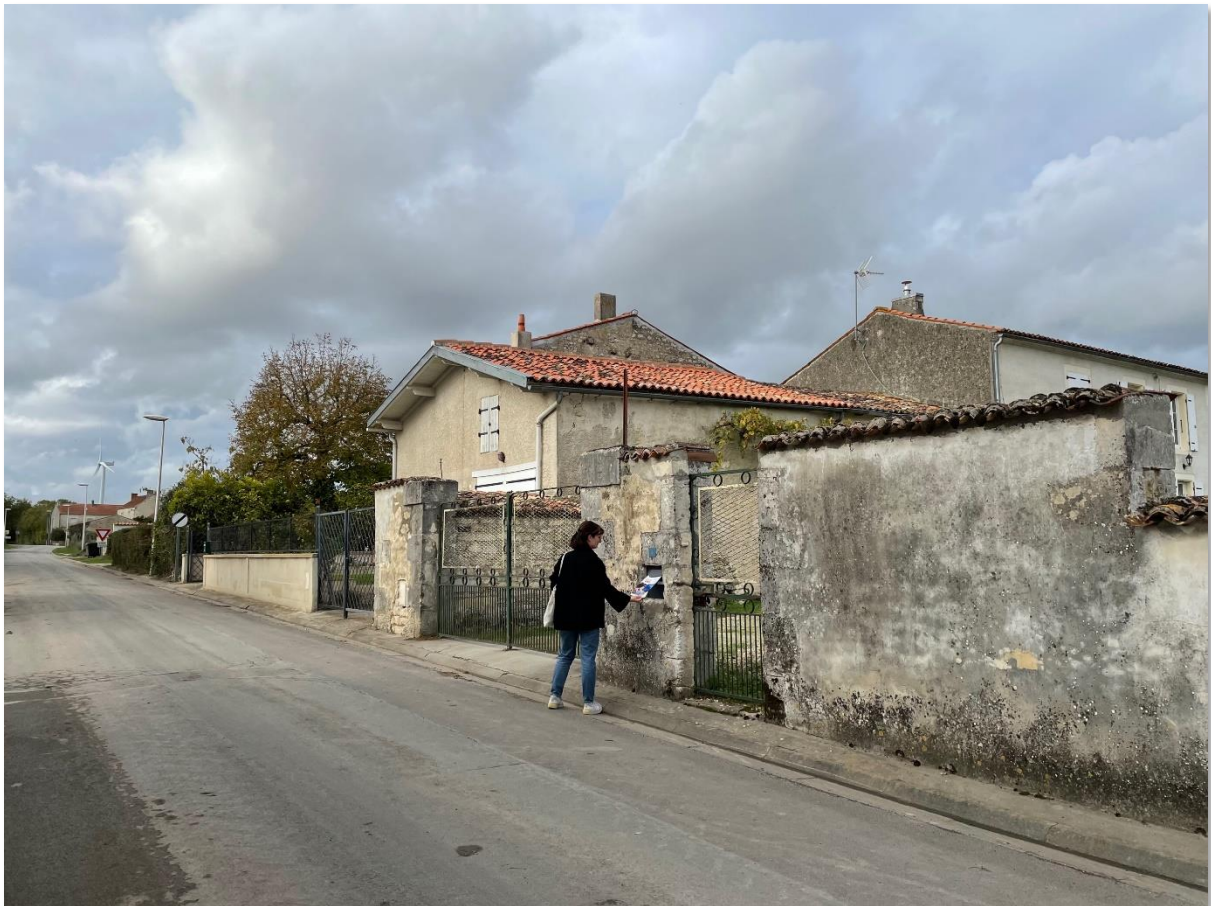
Porte-à-porte à Saint-Pardoult (novembre 2022)